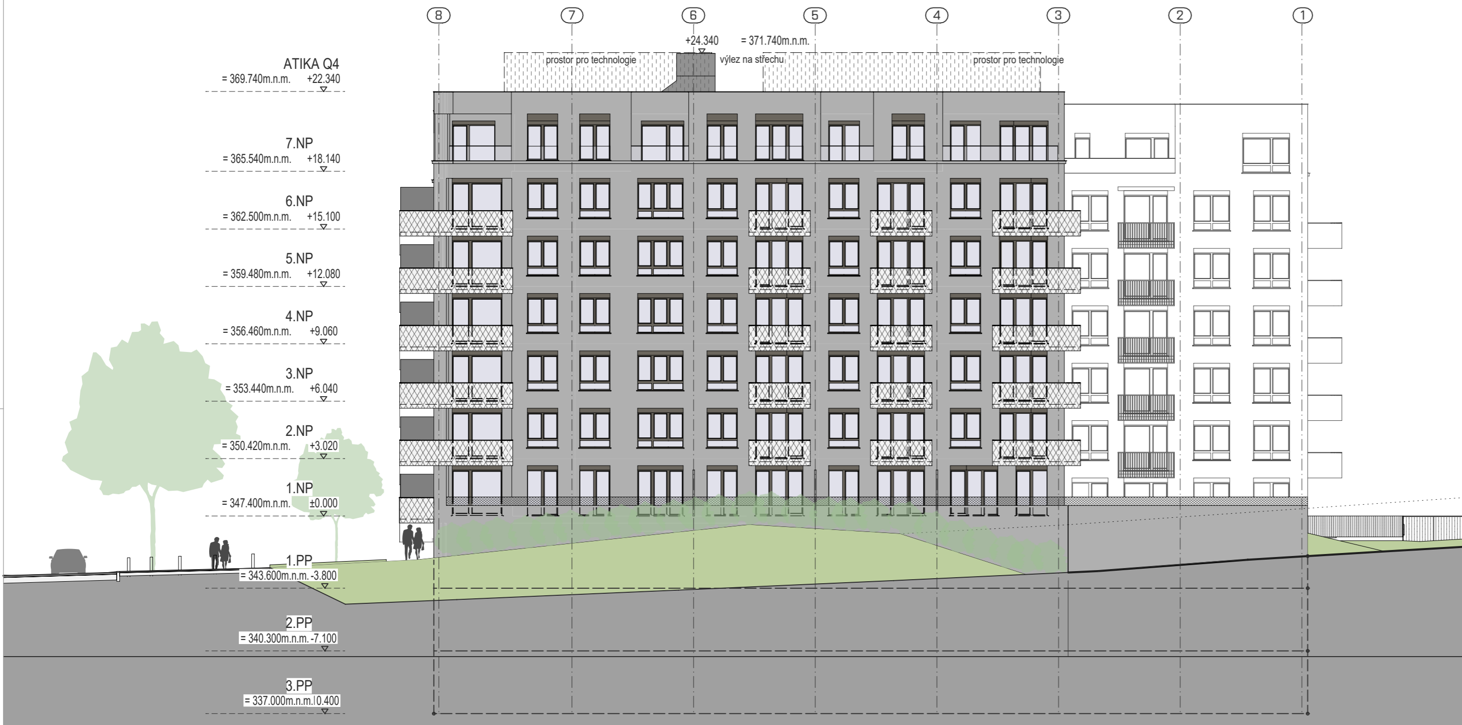
POHLED Q4 OD SEVEROVÝCHODU